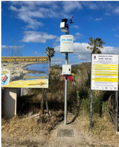
Stazione 3 – Zona Vasca di fango – Spiaggia acque calde