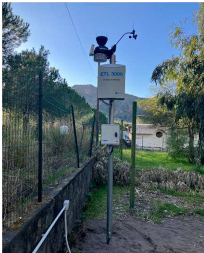
Stazione 5 - Camping