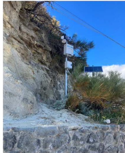
Stazione 4 – Zona Porto