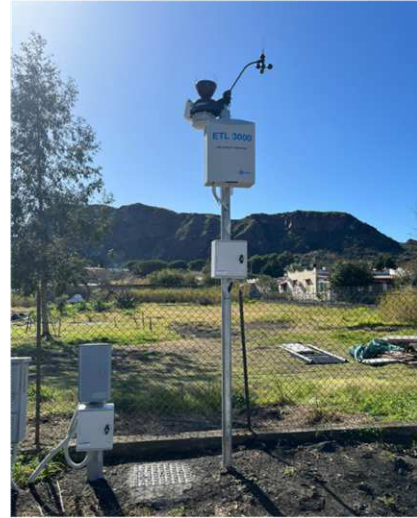
Stazione 2 - Panificio