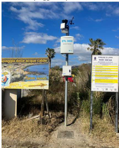
Stazione 3 – Zona Vasca di fango – Spiaggia acque calde