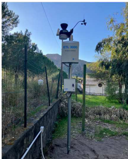
Stazione 5 - Camping