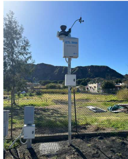
Stazione 2 - Panificio