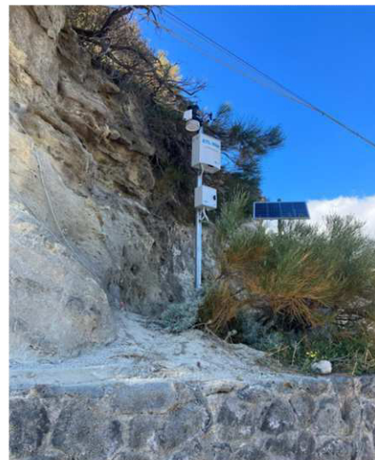
Stazione 4 – Zona Porto